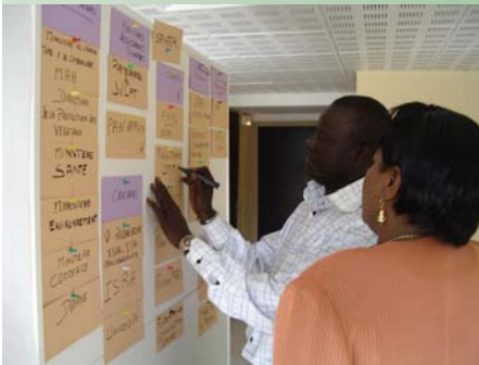
Membres exécutifs de CropLife Sénégal finalisant un scan de l'environnement de l'association. Bamako, Mali, décembre 2004.

En 3 ans de partenariat et dans 6 pays d'Afrique, IFDC et CropLife ont ensemble formés 74 formateurs issus des secteurs public et privé pour l'utilisation responsable des produits phytosanitaires. Dans chaque pays, les Formations de Formateurs ont été organisées par l'association CropLife nationale; CropLife Afrique Moyen-Orient a financé les ateliers et IFDC a mis à disposition 2 facilitateurs.